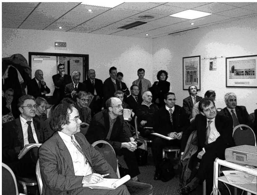
Auditeurs nombreux et attentifs

Ils pourraient également afficher sur le site www.adeli.org une présentation concise de leurs activités, accompagnée d'un lien vers leur propre site.