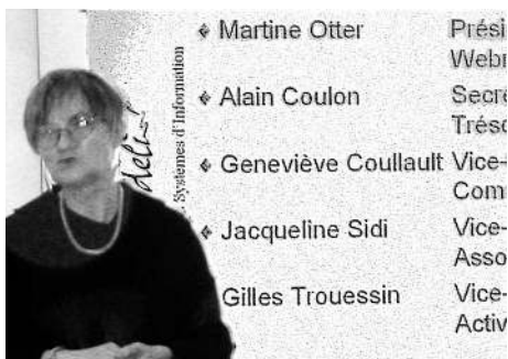
Rappel de la composition du Bureau 2004

Lors de sa première réunion du 14 janvier 2004, le Comité avait élu son Bureau :