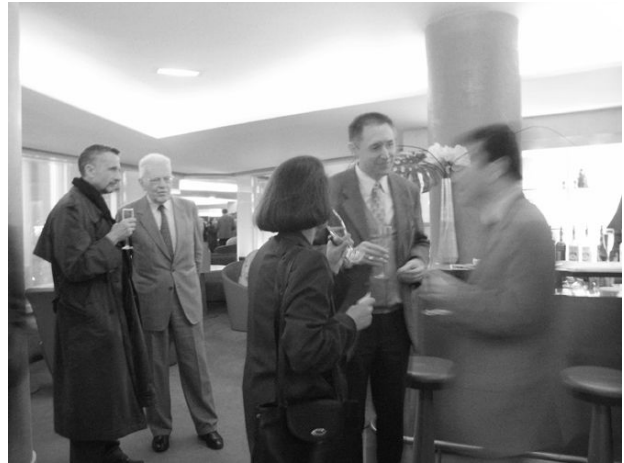
Discussions devant le bar

Nous avons poursuivi les conversations en petits groupes, une flûte de champagne à la main en grignotant quelques gougères, au bar du 1 er étage.