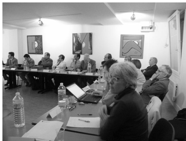
L'attention s'est maintenue durant plusieurs heures