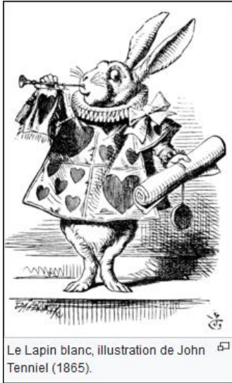
Le Lapin blanc, illustration de John Tenniel (1865).

Pour commencer, les trois personnes présentes derrière le bar s'efforcèrent de nous montrer, je suppose, qu'elles étaient occupées par une conversation aussi indispensable qu'interminable et qu'il était hors de propos de suspendre même un instant. Nous fîmes tout d'abord preuve d'une longue patience en attendant, puis poussâmes l'audace jusqu'à leur demander aimablement si nous pouvions commander des crêpes, ce qui sembla les désarçonner, tant notre question semblait être une bizarrerie d'« extraterrestres ».